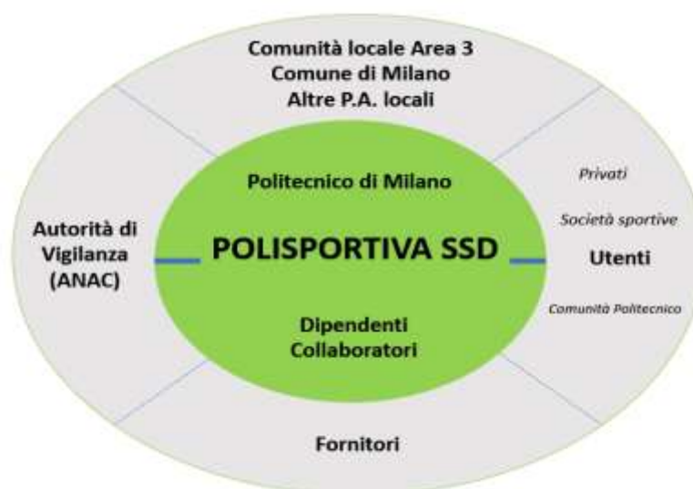
Fig. 2 –Stakeholder interni ed esterni della Società.

La Società ha individuato i propri stakeholder distinguendoli tra interni ed esterni: